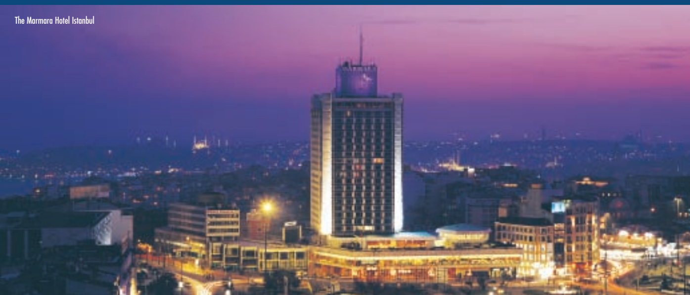
The Marmara Hotel Istanbul