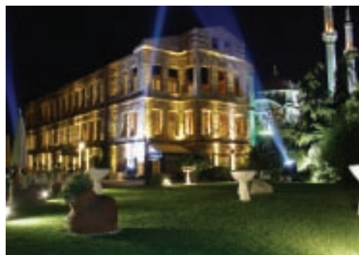
Esterno notturno del Marmara Esma Sultan