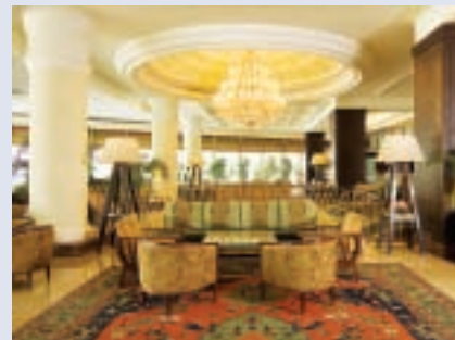
The Marmara Istanbul - Lobby

IL SEGMENTO MICE È UNO DEI MERCATI PRINCIPALI NEI QUALI IL GRUPPO MARMARA HOTELS OPERA DA ANNI CON I SUOI ALBERGHI DI ISTANBUL, ANTALYA, BODRUM E NEW YORK.