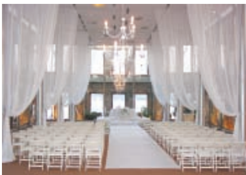
Marmara Esma Sultan - Interno