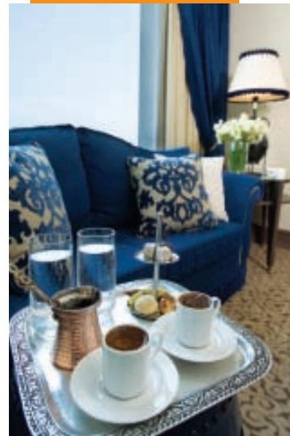
The Marmara Istanbul

Tutti i nostri alberghi inoltre godono della migliore posizione e della vista più bella della città in cui sorgono. Oltre a ciò possiamo dire che The Marmara Hotels sponsorizza diverse attività culturali ed artistiche. Da più di 14 anni, ad esempio, siamo l'hotel ufficiale della IKSV , la Fondazione per La Cultura e l'Arte di Istanbul.