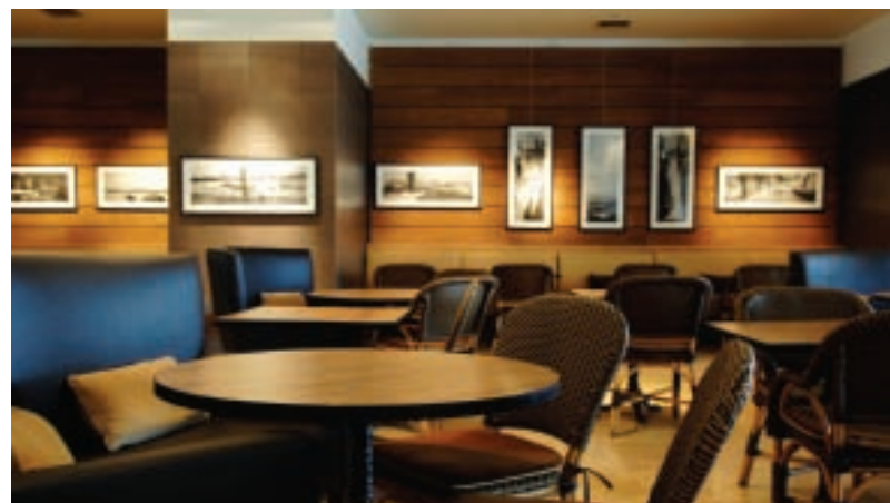
The Marmara Istanbul - Marmara Café