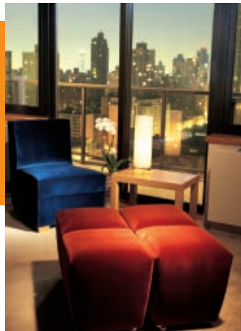
The Marmara Manhattan