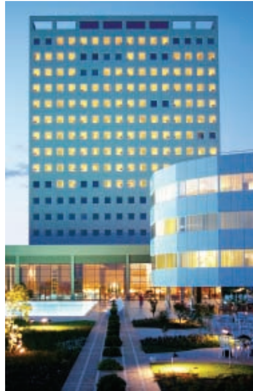
The Marmara Antalya

so gratuito al collegamento Wi-Fi dal loro computer portatile. Le Club Rooms sono equipaggiate con TV LCD con accesso a internet da tastiera senza fili, accesso a internet Wi-Fi, quotidiani gratuiti, lussuosi bagni in marmo, servizio di congiungerie personalizzato 24 ore al giorno, turn down serale e servizio di tintoria e lavanderia con consegna nello stesso giorno. Inoltre nelle Suites Executives e Flying Carpet si trovano anche stampanti multi-uso (fax, fotocopiatrice, stampante e scanner), lettore DVD, jacuzzi e televisore LCD in bagno.