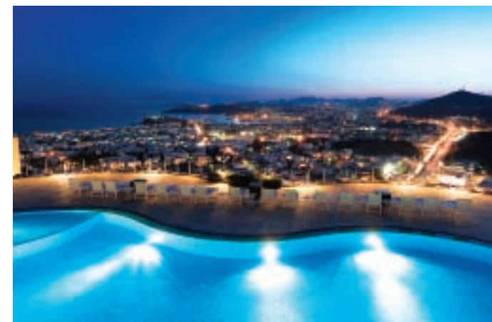
The Marmara Bodrum