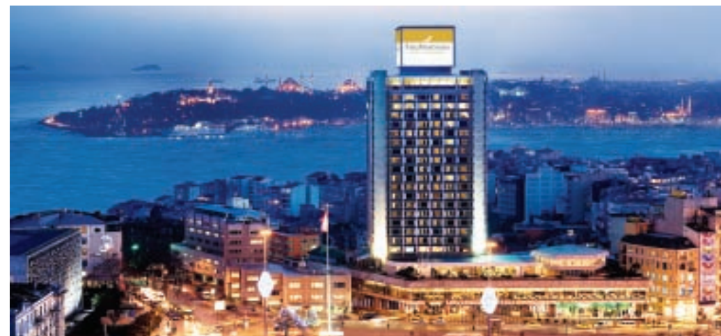
The Marmara Istanbul

Per esempio al The Marmara Istanbul abbiamo 46 esclusive Club Rooms ed una raffinata Lounge riservate agli ospiti più esigenti. Gli ospiti del The Marmara Club che alloggiano in queste stanze hanno accesso gratuito durante tutto il giorno alla The Marmara Club Lounge - con splendida vista 360 gradi sul Bosforo - dove oltre alla colazione possono consumare tè, caffè, cocktail e stuzzichini, avere la possibilità di check-in e check-out separato, sale per cene e meeting privati, e l'acces-