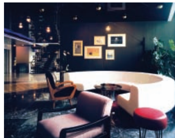
The Marmara Pera